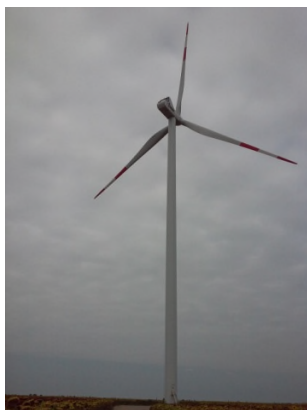
Slika 2. Vetrenjača vetoparka „La Piccolina“

Osim toga što su vetrenjače bezbedne za životnu sredinu, doprinele su razvoju zajednice, njihova izgradnja obezbedila je zaposlenje za više od 50 radnika, a neki i danas rade na njihovom obezbeđenju.