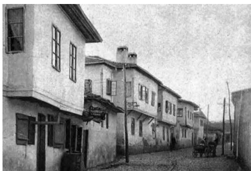
Slika 3: Jevrejska ulica u Beogradu XIX vek [8]

J. Krnić [1] tvrdi da težnja da se srpska arhitektura oslobodi prenošenja tuđih likovnih motiva, bila je najpotpunije izražana u želji za stvaranjem „srpskog graditeljskog stila“ koji je mogao da bude prepoznat u principijelnosti smeštaja, doslednosti orijentacije, funkcionalnosti dispozicije, standardizaciji unutrašnjeg uređenja, što su i bile opšte osobine balkanske arhitekture .