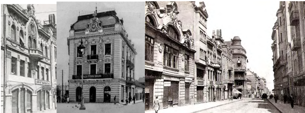
Slika 5. Kuća A. Levija[8] Slika 6. Palata Zora u K. Mihailovojiz 1904.[8] Slika 7. Kuće u Ulici Kralja Petra[8]

stvaralaca . Folklorizam je bio logična težnja za sintezom tradicionalnih oblika narodnog neimarstva i sa osnovama ranog modernizma, bezornamentalnom fasadom i slobodnim oblikovanjem osnove. Uticaj moderne u Srbiji ipak je bio silovit. Između 1929. i 1933. godine budućnost razvoja srpske arhitekture bila je rešena. Svi raniji pokreti i stilski tokovi bili su prekinuti ili podređeni modernizmu. Ovakav polet u projektantskoj praksi zadržao se do II svetskog rata, od kada će događanja u graditeljstvu sveta i Srbiji krenuti nekim drugim tokom.[5]