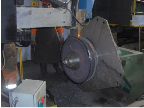
a) proces navarivanja