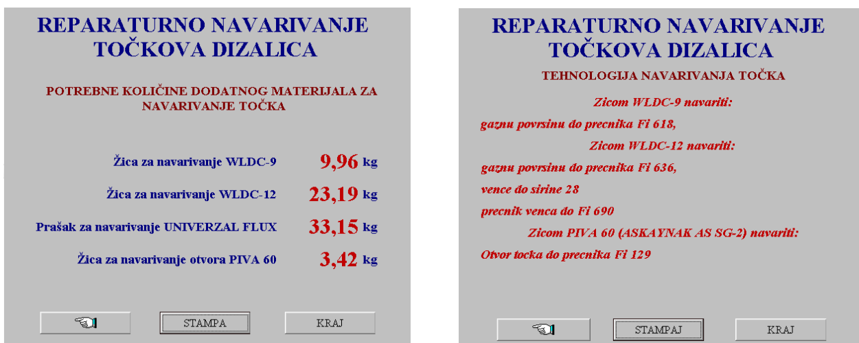
Slika 5 Ekran sa prikazom Potrebne količine dodatnog materijala i Tehnologije navarivanja - uputstvo za zavarivača