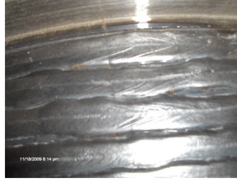
b) izgled gazne površine točka posle navarivanja