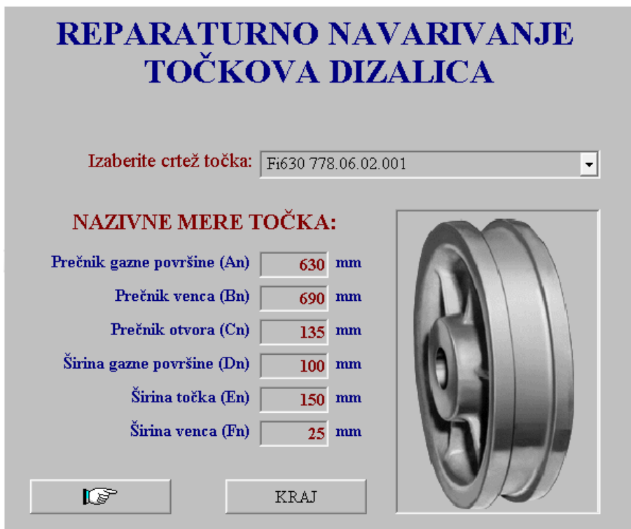
Slika 3: Ekran za izbor točka na osnovu broja crteža

Tehnologije reparaturnog navarivanja, u softver se unosi broj crteža/prečnika točka (slika 3) i mere predobrađenog točka za navarivanje (slika 4) - faza 6 Tehnologije, softver automatski izračunava potrebne količine dodatnih materijala (slika 5) i izrađuje tehnologiju navarivanja - Uputstvo za navarivanje (slika 5). Štampani izveštaji o količini dodatnih materijala i uputstvo za navarivanje prikazani su na slici 6. Program je urađen u Visual Basicu zbog brzine izrade softvera i fleksibilnosti koji programski jezik pruža.