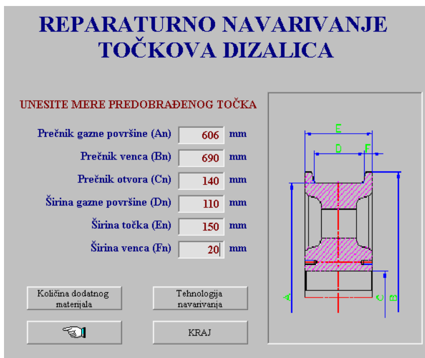
Slika 4: Ekran za unos mera predobrađenog točka