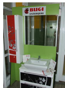
Изложба у холу Амфитеатра 109: Штанд: BugiEnterijeri d.o.o. , Севојно