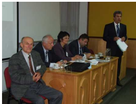
Председавајући Округлог стола: