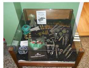
Изложба у холу Амфитеатра 109: Штанд: Први Партизан - Наменска производња, Ужице