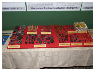
Изложба у холу Амфитеатра 109: Штанд: Sinter d.o.o., Ужице