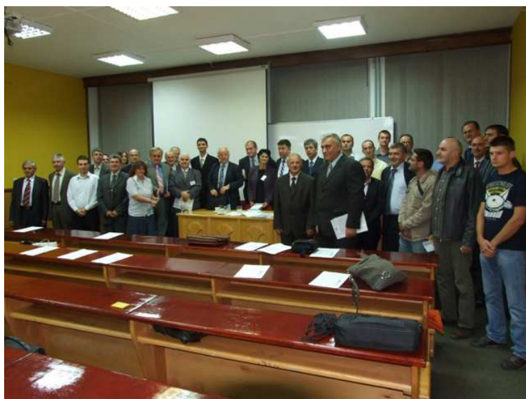
Учесници Округлог стола