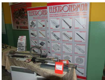
Изложба у холу Амфитеатра 109: Штанд: Електротермија, Ужице

Заједничка фотографија учесника Округлог стола