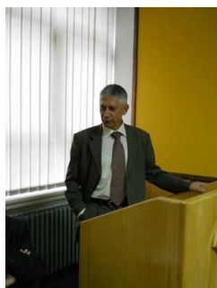
Примери добре праксе-приказ