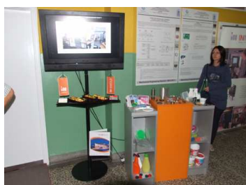
Изложба у холу Амфитеатра 109: Штанд: INMOLD d.o.o., Пожега