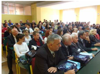
SED 2011 Пленарна седница