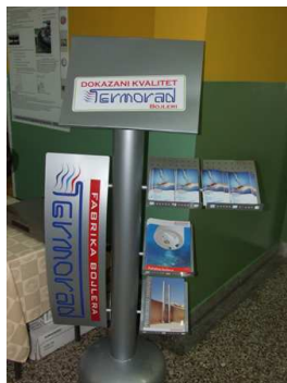
Изложба у холу Амфитеатра 109: Штанд: Termorad d.o.o. , Пожега