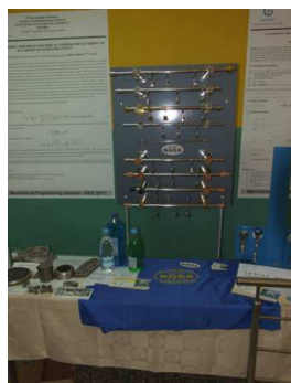
Изложба у холу Амфитеатра 109: Штанд: Fero Term & Biznis Inkubator, Ужице Атеље BOSS, Ужице Армида, Ужице...