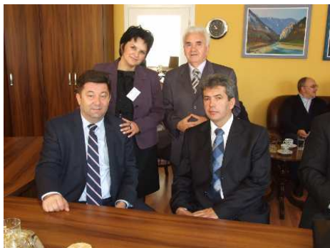
Пријем у канцеларији директора ВПТШ Ужице

Boolean equations and Boolean inequations