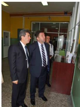
Изложба у холу Амфитеатра 109: