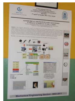
Изложба у холу Амфитеатра 109: Део постера радова секције Производно машинство