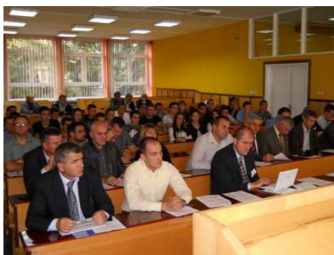
Амфитеатар 109: Учесници Округлог стола Машинство и високо образовање - Иззови XXI века