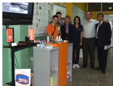
Изложба у холу Амфитеатра 109: Штанд: INMOLD d.o.o. , Пожега