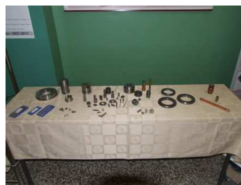
Изложба у холу Амфитеатра 109: Штанд: Woksal d.o.o. , Ужице