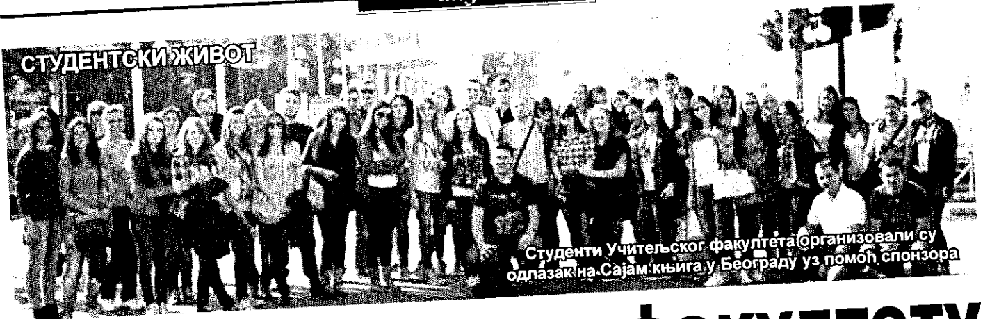
Студенти Учитељског факултета организовали су одлазак на Сајам књига у Београду уз помоћ спонзора